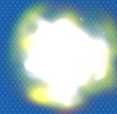
ゴールを発見してクリア